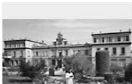
Hospital de beneficència