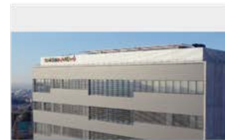
Hospital de referència internacional