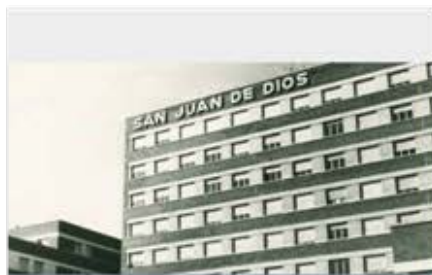
Hospital de pediatria general